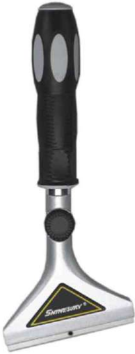
Raspador quita pintura con mango Rf. SX885