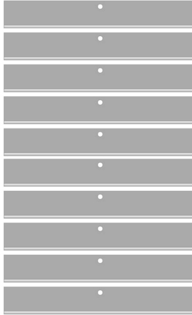
set de cuchillas x 10 para la referencia (Sx885) Rf. SX802T-10