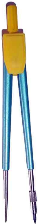
Compas Rf. 100L